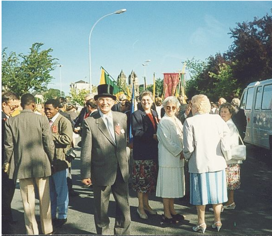
Noyon les 23 et 24 juin 1990 - Euréloy