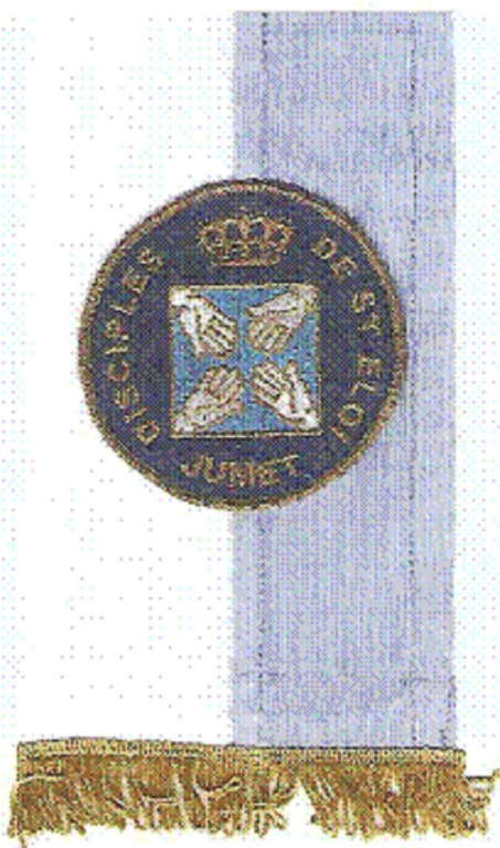
Médallions, capulet et bannière des Disciples de Saint Eloi de Jumet Heigne Insignes des Marguilliers et de la Confrérie Saint Eloi - Euréloy - Noyon 1990